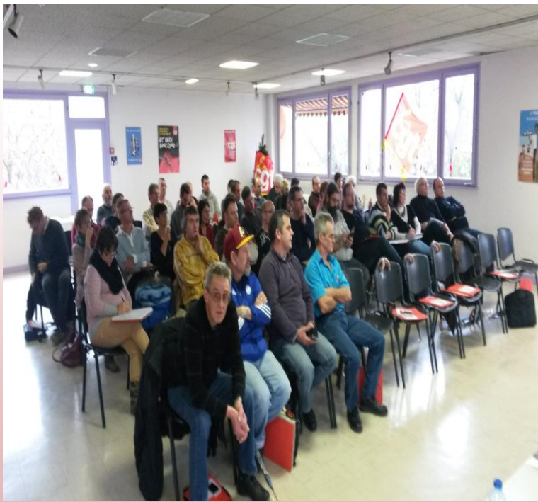
COMITE DEPARTEMENTAL Décembre 2014