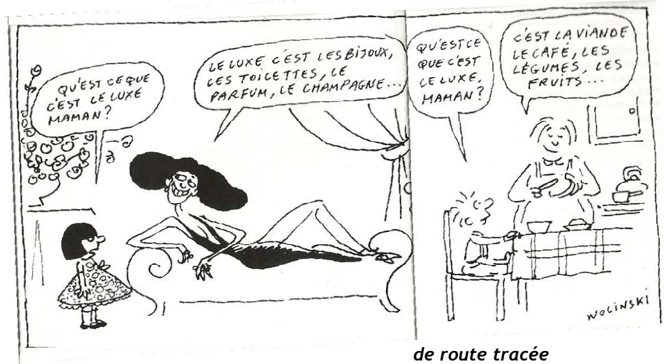
de route tracée

Ce moment que nous vivons nous interpelle dans tous les domaines, Liberté – Égalité – Fraternité – Laïcité – valeurs de la République – mais comment enseigner les valeurs de la République à ceux à qui la République n'accorde pas ou peu de valeurs ? – Bien sûr qu'il faut enseigner les valeurs de la République, tout autant que la République doit les respecter elle-même. (Extraits de l'intervention sur ce point)