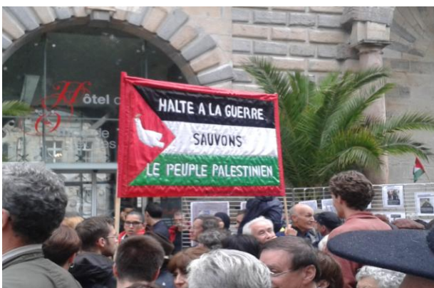
Manifestation de soutien au peuple Palestinien et pour l'arrêt des massacres à GAZA le 22 juin 2014 à Besançon