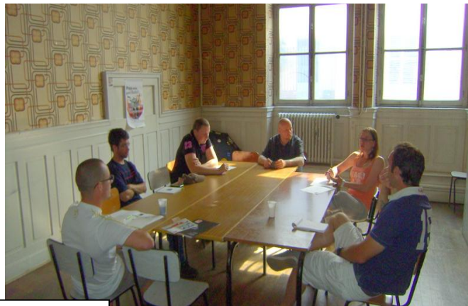
Les groupes de travail