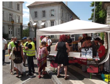
Manif du 26 juin 2014 à Vesoul