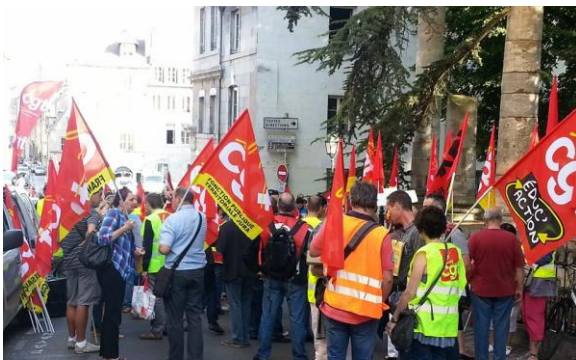
Manif régionale contre le plan lycée de la Présidente de région du 27 juin 2014